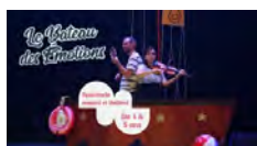
Compagnie Zik Zak