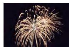
Feu d'artifice pexels-photo-1252509