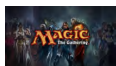
Magic The Gathering