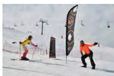
Xspeed Ski Tour