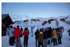
OT Coeur d'Auvergne