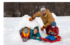
OTT Cœur de Maurienne