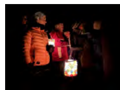
OT Cœur de Maurienne