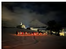
OT Coeur d'Auvergne