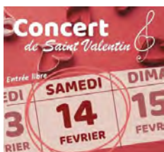
Lyre Grégorienne Jarrier