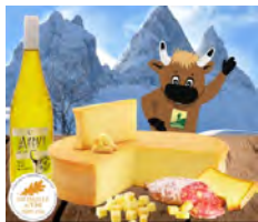
SICA des Arves