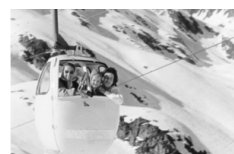
Médiathèque Louise de Savoie