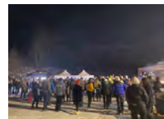
Méthode BOS - OTI Montagnicimes

Comité des fêtes de Saint-Pancrace ☎ 04 79 83 51 51