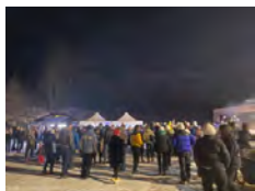
Méthode BOS - OTI Montagnicimes

Comité des fêtes de Saint-Pancrace ☎ 04 79 83 51 51