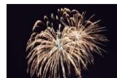
Feu d'artifice pexels-photo-1252503