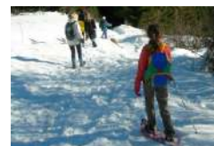
S. Pommi - Fondation Facim