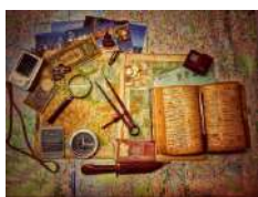
Srinash Wuri Unspaga