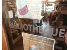
Mairie de Jarrier