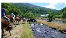
le pied à l'étrier